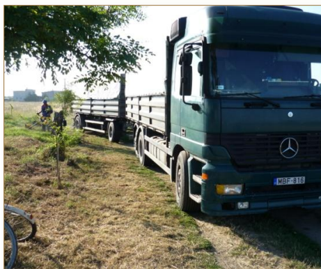
Material for the fence arrives to the cemetery

Resting site of Rabbi Menachem Zev Schick zt"l