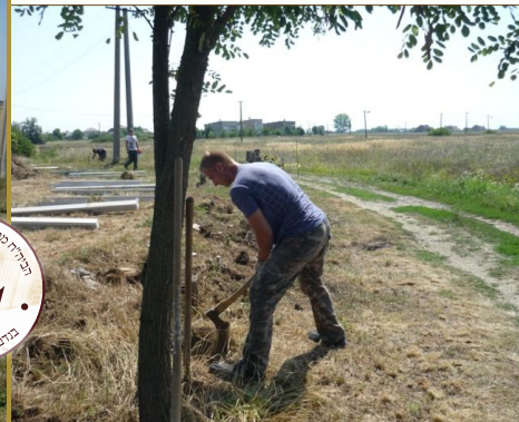
Grounds are being prepared for the construction