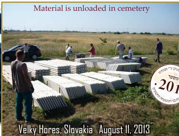
Material is unloaded in cemetery