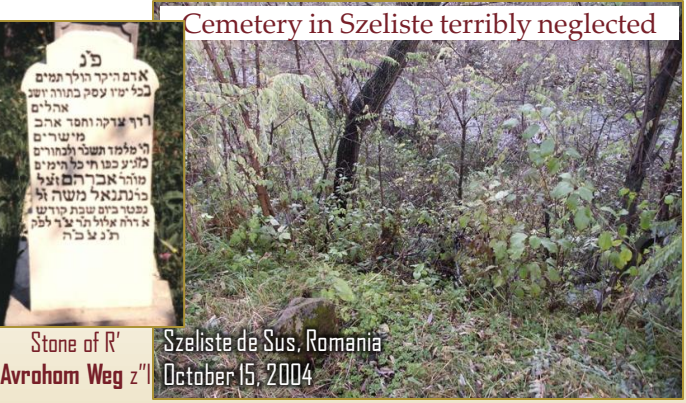
Cemetery in Szeliste terribly neglected